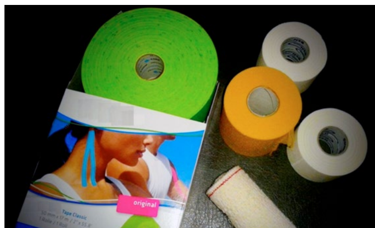
El material como los vendajes neuromusculares, el esparadrapo de tipo tape y otros tipos de vendas, suelen ser utilizados con funcionalidades diferentes según la patología de base. Fotografía de Noelia Frutos Ruiz.

El material puede ser innumerable por la gran variedad disponible, aunque también dependerá de las adaptaciones y creatividad que el profesional pueda aportar.