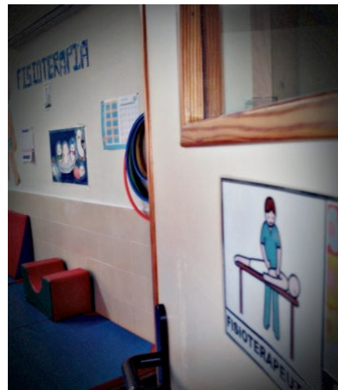
Entrada a una sala de Fisioterapia en un CPEE.

La Fisioterapia Educativa se puede definir como la aplicación de los conocimientos específicos de la disciplina de la Fisioterapia a niños con necesidades educativas especiales de carácter motriz durante el periodo escolar, a través de un enfoque de actuación interdisciplinar para facilitar al niño la consecución de los objetivos establecidos en el currículo educativo (autonomía, independencia, socialización, etc.) (Cánovas & Salazar González, 2002).