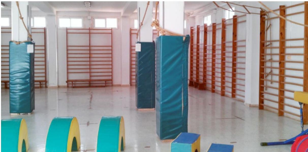
Fisioterapeutas y maestros de Educación Física comparten frecuentemente además de alumnos, espacios, objetivos de trabajo y materiales.

La asignatura de Educación Física educa en el desarrollo de las habilidades y destrezas básicas y en las capacidades físicas y estimulando al alumnado hacia la práctica de actividad física y deportiva, trabajando para desarrollar su condición física y promocionando un patrón de vida activa y saludable, siempre en congruencia a su edad cronológica.