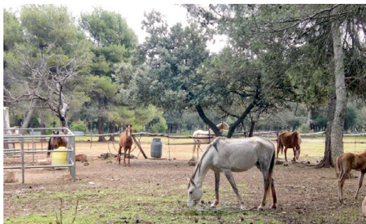
Los centros ecuestres son un recurso en auge para que los niños con diversidad funcional motora puedan acudir a recibir fisioterapia específica para la normalización del tono muscular, mejora de la postura y estimulación psicomotriz.