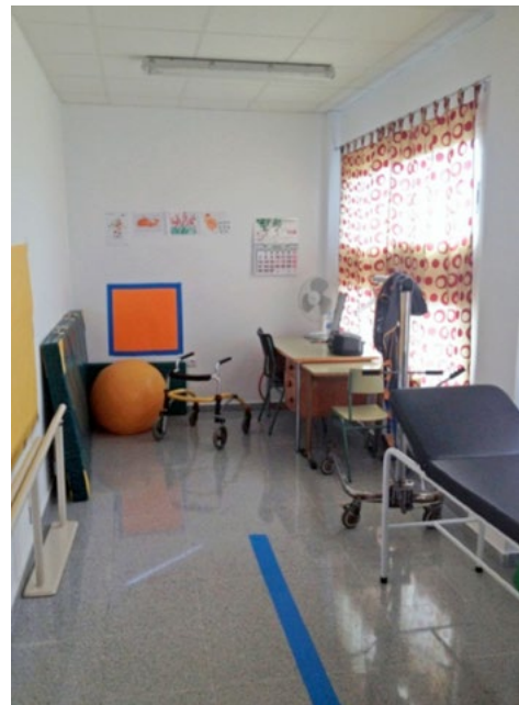
Las aulas de Fisioterapia se adaptan al espacio disponible en cada centro escolar en busca de la mayor funcionalidad para los alumnos.

Las necesidades de espacio deben tomar en consideración los desplazamientos que se producen dentro del Aula por el movimiento de sillas de ruedas, bipedestadores, andadores y grúas de transferencia.