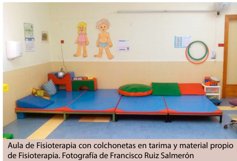
Aula de Fisioterapia con colchonetas en tarima y material propio de Fisioterapia.