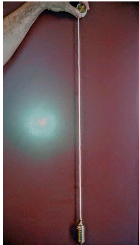
La plomada es uno de los materiales de evaluación para las desalineaciones del raquis.