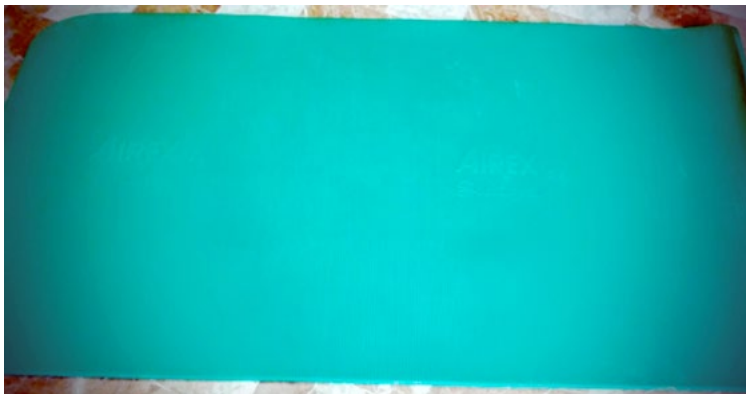
Las colchonetas son un elemento indispensable en la Fisioterapia Educativa. Su gran movilidad para desplazar y su consistencia permiten realizar el tratamiento prácticamente sobre cualquier superficie.

El fisioterapeuta encargado en el Equipo Específico de Atención a Deficiencia Motora mantiene un conocimiento actualizado de la situación y necesidades de los alumnos con necesidades educativas especiales asociadas a diversidad funcional motora; también del inventario y necesidad de los recursos disponibles dentro de la estructura de la Consejería de Educación, como las Ayudas Técnicas Individuales (ATI).