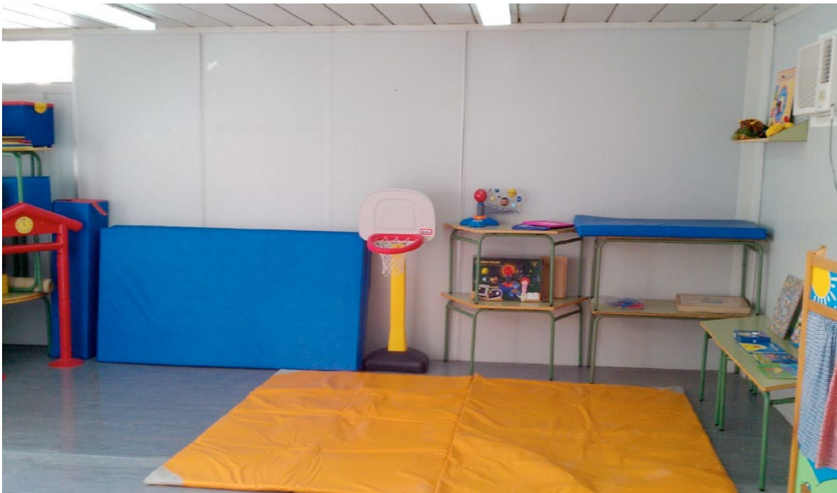
Aula de Fisioterapia en una Escuela Infantil.