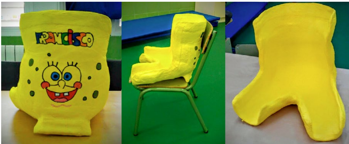
Asiento pélvico en yeso moldeado realizado por tres fisioterapeutas en un Equipo de Orientación Educativa y Psicopedagógica.

En alumnos que no tienen una sedestación estable se formula la necesidad de evaluación previa por parte del fisioterapeuta y posteriormente se realiza una citación para poder hacer el molde de asiento con yeso.