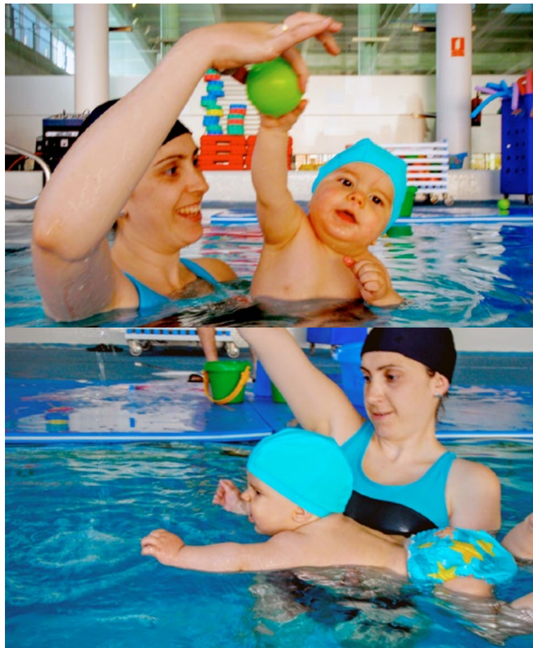
La Fisioterapia en el agua permite aprovechar la flotabilidad, la resistencia del agua, las nuevas texturas y las propiedades del agua para estimular de una manera positiva a los alumnos con necesidades educativas especiales.

Aún más reciente es la introducción de animales domésticos con finalidad terapéutica, generalmente domésticos, para el tratamiento de niños con trastorno del espectro autista o muy gravemente afectados; es la llamada terapia asistida con animales o zooterapia que se está utilizando en otras comunidades autónomas con éxito (Abellán, 2008).