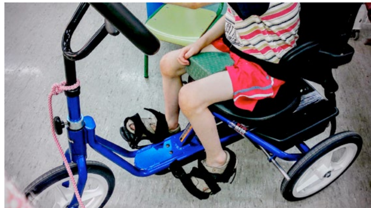
Un triciclo adaptado a partir de las posibilidades de movimiento del alumno y del análisis de las adaptaciones ortopédicas que pudieran mejorar su autonomía en el mismo.

Las reuniones de trabajo y de puesta en común se proponen cada cierto tiempo, para actualizar conocimientos y conocer nuevas aplicaciones tecnológicas de materiales ortoprotésicos o realizar pruebas específicas de novedades en alumnos concretos.