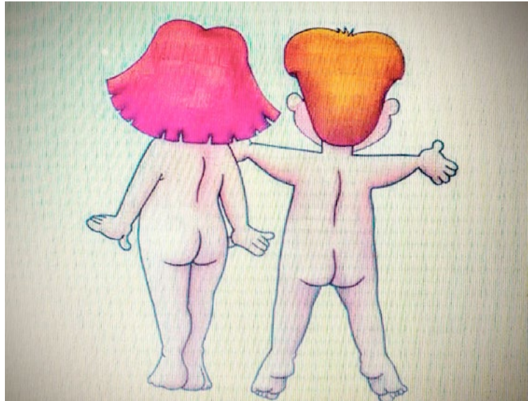
La Higiene Postural es un conocimiento importante para los niños desde las primeras edades, de cara a la protección de su espalda y para un normal desarrollo.

En España, un programa de gran repercusión elaborado por los Colegios Profesionales de Fisioterapeutas educa a alumnado y docentes en todas las Comunidades autónomas por medio de los profesionales de la Fisioterapia.