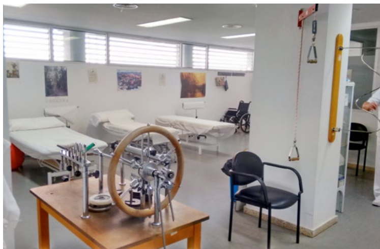
La Fisioterapia se asocia frecuentemente al entorno sanitario de hospitales y centros de salud, pero está presente en el entorno educativo.

La Organización Mundial de la Salud también participó partiendo de las definiciones de la WCPT y a través de su Comité de Expertos enunció esta definición: “La Fisioterapia es la ciencia del tratamiento a través de: medios físicos, ejercicio terapéutico, masoterapia y electroterapia. Además, la Fisioterapia incluye la ejecución de pruebas eléctricas y manuales para determinar el valor de la afectación y fuerza muscular, pruebas para determinar las capacidades funcionales, la amplitud del movimiento articular y medidas de la capacidad vital, así como ayudas diagnósticas para el control de la evolución” (World Health Organization, 1968).