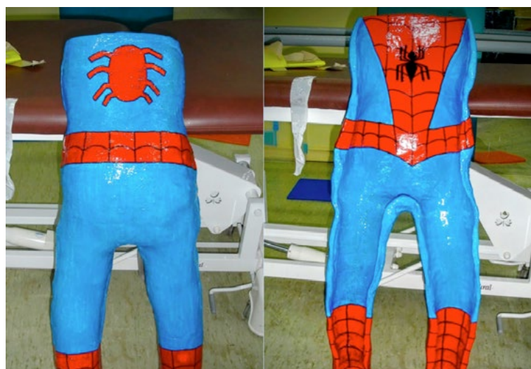
El "Standing" en escayola o bipedestador es otra modalidad de las realizadas por los fisioterapeutas educativos. Permite a los alumnos permanecer como en un bipedestador pero sin roces, pues se ejecuta moldeado a medida y queda perfectamente adaptado al cuerpo del niño; además se decora de forma atractiva para ellos como en este "traje de Spiderman".

Posteriormente se harán las pruebas sentados en el aula, el moldeado final para su uso durante las clases y el acoplamiento a la silla para garantizar una profilaxis en la posición sedente fisiológica que no altere el crecimiento de raquis ni pelvis.