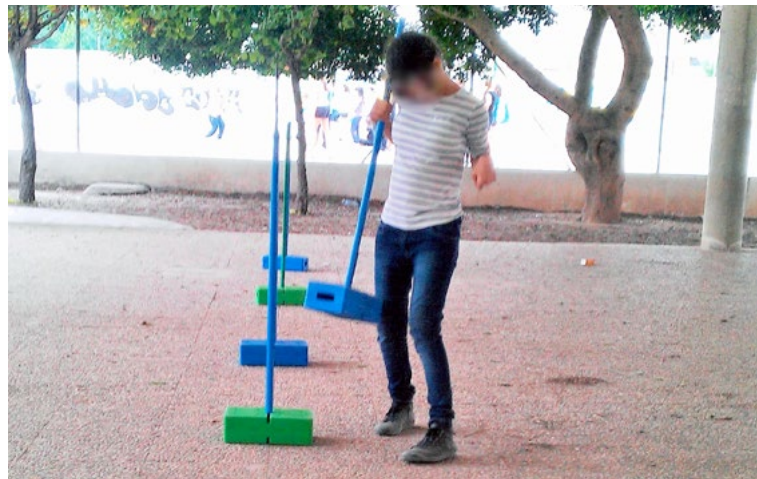
Alumna realizando actividad de equilibrio en horas de apoyo de fisioterapia en el patio de su centro.

Aunque insistimos que estas localizaciones pueden ser más puntuales o fruto de un trabajo específico de superación o progresión que la tónica de apoyo diario de Fisioterapia.