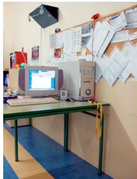
Puesto informático para las labores administrativas del Fisioterapeuta Educativo.

Otra finalidad accesoria de tipo educativo de estos equipos portátiles puede ser la de entretener a los alumnos más pequeños mientras reciben el apoyo de fisioterapia; de esta manera pueden ver un cortometraje de dibujos entretenidos mientras sus músculos están estirándose durante varios minutos o escucha la música que más les gusta mientras mantiene la posición de pie en un bipedestador por tiempo prolongado sin que les sea tan molesto o facilitando la distracción frente a estímulos dolorosos.