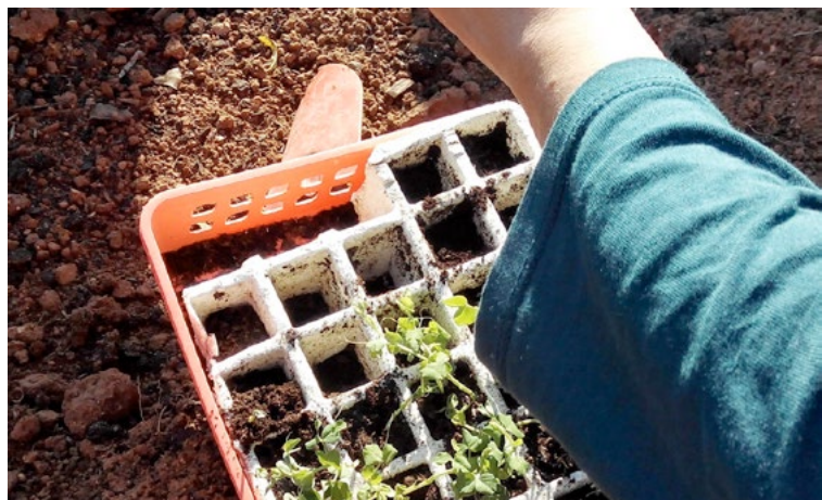
Una salida al huerto escolar puede servir para trabajar la manipulación o para desplazarse en un terreno irregular.